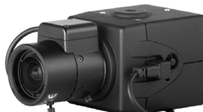
( 镜头不随摄像机提供 )

C10CH 是一款具有 540 TVL 分辨率和 0.3 lux 照度的超高分辨率的数字摄像机。此款摄像机具有自适应电源 (带有内置线锁定的 24 VAC 或带有内部同步的 12 VDC)，自动增益控制 (AGC)，电子快门控制 (ESC) 和无闪烁模式功能。 C10CH 同样包括不理想光线环境下的 AWB 白平衡功能，模拟日蚀功能可使自动光圈镜头在强逆光背景处产生清晰图像，逆光补偿功能可对图像进行调整以防止物体在强背光下显得太暗。这些功能可以通过屏幕菜单轻松实现。