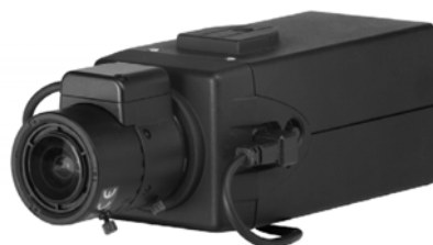
( 镜头不随摄像机提供 )

C10CH 配有标准的 CS 镜头安装接口，可使用固定、手动的或自动光圈 (DC 或视频驱动) 镜头。光圈通过所有 Pelco 自动光圈镜头都具有的标准四针方型接头驱动。